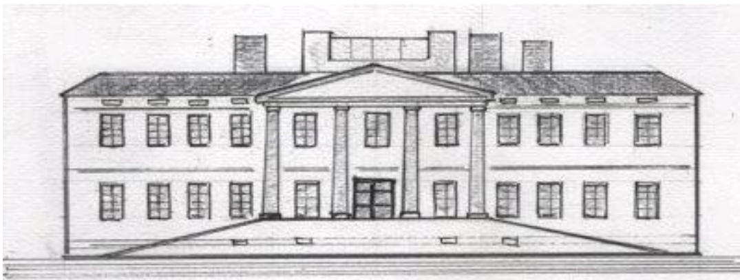
Szkic pałacu od strony wschodniej.