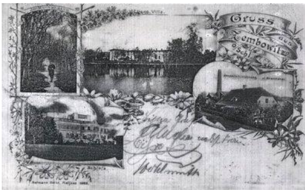
Stara widokówka z Zębowic (w lewym rogu widok na zachodnią część zamku)

Po kilku latach obiekt przekazano Gminnej Spółdzielni, która otworzyła tam gospodę.