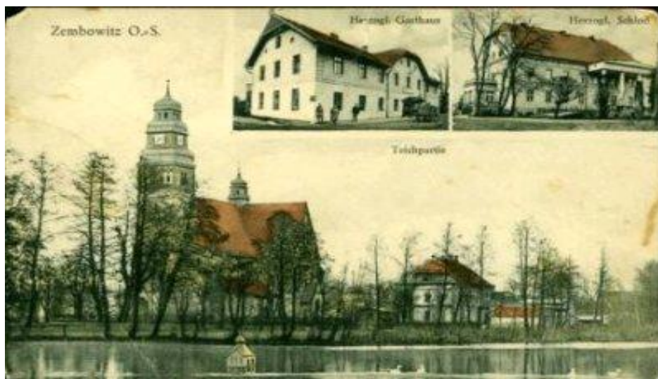
Widokówka z lat 30-tych. Panorama Zębowic z kościołem, pałacem i gospoda księżęcą.

Dziś pałac niszczy w zawrotnym tempie. Mury pokryte są grzybem, tynk z odnawianych niegdyś elewacji odchodzi płatami. W salach i na korytarzach nie ma już desek, czy posadzek. Kafłowe piece są zniszczone, w ścianach i podłogach powybijane są dziury. Wszędzie walają się gruz, puszki, potłuczone butelki i szyby. Miejscowi wandale coraz bardziej dewastują zabytek. Jednym słowem stan zamku jest tragiczny.