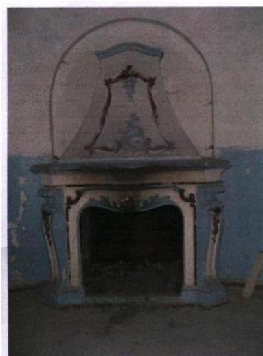
Jedyny zachowany kominek.