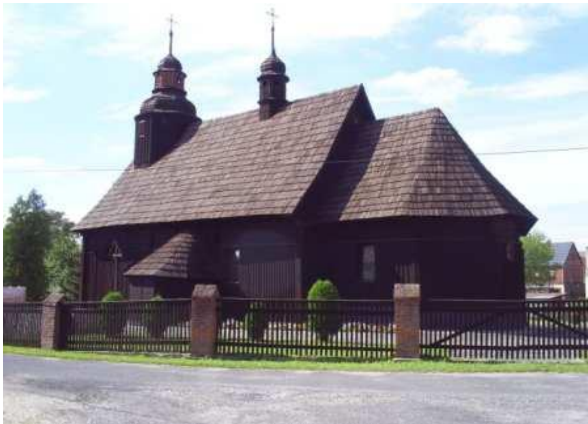
Zębowice, kwiecień 2011r.