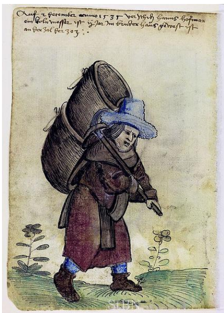
Rys.3. Węglarz niosący węgiel w koszu wiklinowym

„Trzeba ogień w mielerzu zawsze wolno trzymać A tam z której strony wiatr by nie mógł przedymać Przez raz aż do ognia, sadz piasku niemało Chceszli być się tam węgle popiołem nie stało”