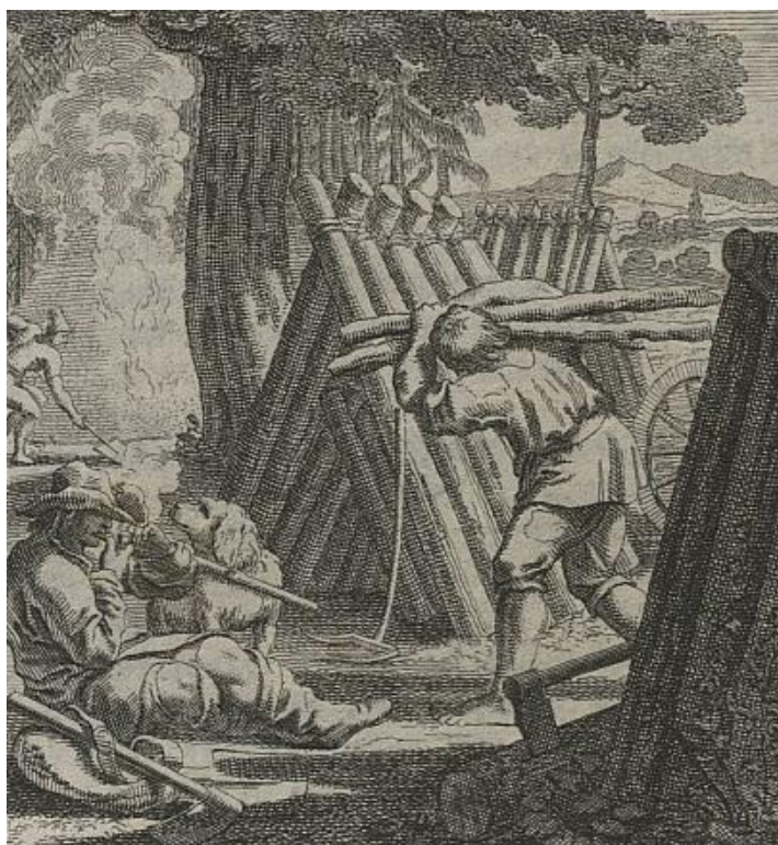
Rys.1. Kurzoucy przy pracy