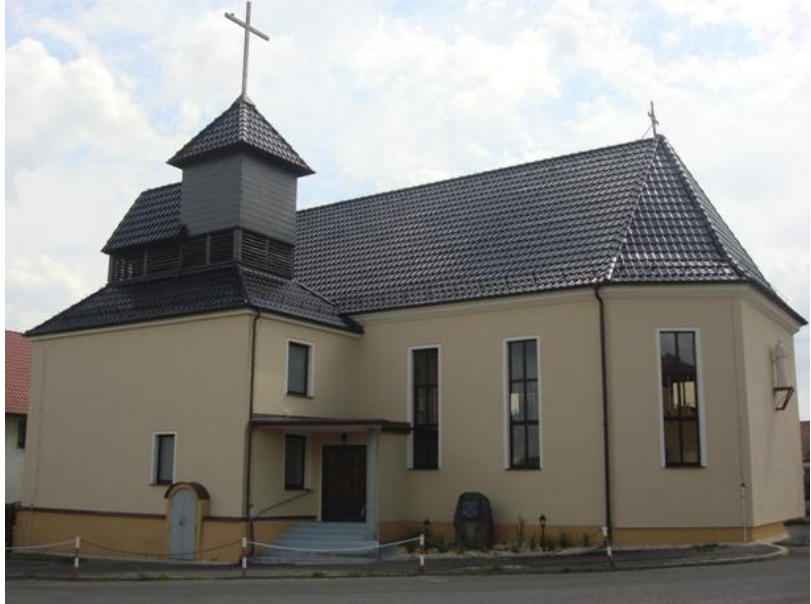
KOŚCIÓŁ FILIALNY W DAŃCU