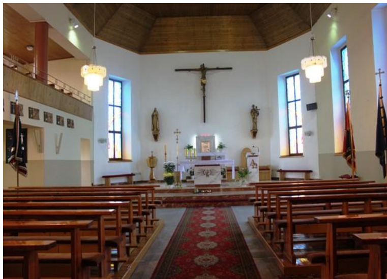
WNĘTRZE KOŚCIOŁA W DAŃCU